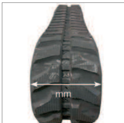
Szerokość (w mm)